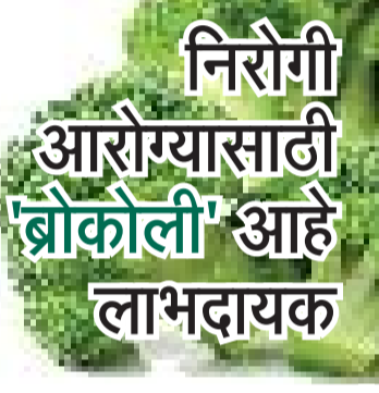
निरोगी आरोग्यासाठी 'ब्रोकोली' आहे लाभदायक

कोणतीही भाजी खरेदी करताना ती सावधपणे खरेदी करणं गरजेचं आहे. कारण आजकाल अनेक खाद्यपदार्थांमध्ये भेसळ करून ते बाजारात विकले जातात. त्यामुळे ब्रोकोली खरेदी करताना काही गोष्टी नीट सावधपणे पाह्यात. ब्रोकोलीची भाजी खरेदी करताना तिचा कंद टणक, हिरवागार ( रंग एकसमान हिरवा असणं), ताजी आहे याची खात्री करून घ्या. ब्रोकोलीची भाजी बाजारातून विकत आणल्यावर हवाबंद पिशवीत टिकवून ठेवावे शकते. मात्र शक्य असल्यास ती लवकर संपवावी. कारण भाजी शिळी झाल्यास तिच्यामधील पोषकतत्त्व कमी होत जातं. हवाबंद पिशवी अथवा डब्यात ब्रोकोली दोन ते तीन दिवस चांगली टिकते.