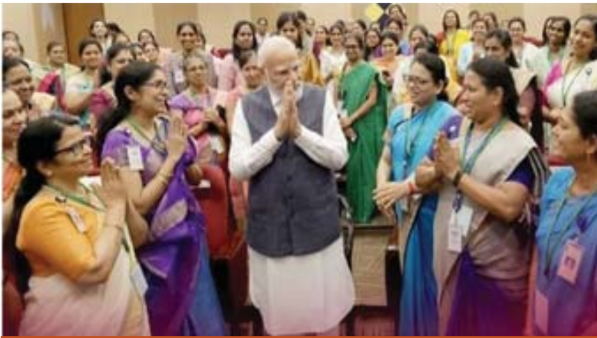
महिला आरक्षण कायदा अर्थात नारी शक्ती वंदन कायदा-2023 दुरुस्तीसाठी केंद्र सरकारने आजपासून संसदेचे विशेष अधिवेशन बोलावले आहे. आगामी लोकसभा-2029 निवडणुकीपासून या कायद्याची अंमलबजावणी करून महिलांना कायदेमंडळात अधिकाधिक प्रतिनिधित्व देण्यासाठी हे अधिवेशन बोलावण्याचं सरकारकडून सांगण्यात येत आहे. प्रत्यक्षात, महिला आरक्षणाला आडून सोपीची मतदारसंघ पुनर्रचना करून आगामी निवडणुकीत त्याचा फायदा उचलणं हाच या अधिवेशनाचा मुख्य उद्देश असल्याचा आरोप विरोधकांकडून होतोय.

महिला आरक्षण कायदा 2023 (नारी शक्ती वंदन कायदा) च्या अंमलबजावणीला गती देण्यासाठी जे घटनादुरुस्ती विधेयक आणलं जाणार आहे, त्याच्या जोडीलाच मतदारसंघ पुनर्रचना कायद्याशी संबंधित एक विधेयक आणि दिल्ली, जम्मू-काश्मीर व पुद्दुचेरी (विधानसभा असलेले तीन केंद्रशासित प्रदेश) यांच्यासाठीही एक विधेयक सादर केलं जाणार आहे. ही विधेयके संसदेत मंजूर झाल्यानंतर लोकसभेची सदस्यसंख्या सध्याच्या 543 वरून थेट 850 पर्यंत जाईल. 'संविधान (131वी सुधारणा) विधेयक, 2026' द्वारे हा बदल सुचवण्यात आला आहे. हे नवीन बदल 2029 चा लोकसभा निवडणुकांपासून लागू होण्याची वाट शक्यता आहे. मात्र, लोकसभा मतदारसंघांच्या जागेतील ही वाढ जनगणनेच्या आदलांवरून होणार नाही. तर, 2011 च्या अर्थात दीड दशक जुन्या जनगणनेच्या आधारे मतदारसंघांची पुनर्रचना करण्याचा केंद्र सरकारचा इरादा आहे. त्यालाच विरोधकांचा मुख्य आक्षेप आहे. महिला आरक्षण विधेयकाच्या आडून केंद्र सरकार हातचलाखी करत