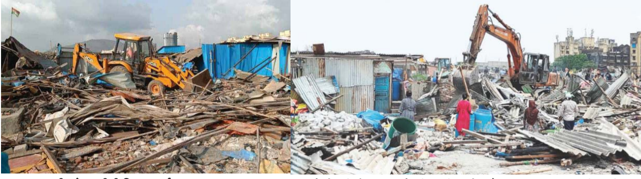
या कारवाईदरम्यान ७ जेसीबी आणि ३ पॉकलेन मशीनच्या सहाय्याने १४०० हून अधिक झोपड्या हटवून २२ एकर जमीन मोकळी करण्यात आली असून उर्वरित अतिक्रमण हटवण्याची प्रक्रिया सुरु आहे. तोडक कारवाईदरम्यान मानखुर्दकडून येणाऱ्या मार्गावर वाहतुकीत बदल करून काही मार्ग एकमार्गी करण्यात आले होते.

२२ एकर सरकारी जमीन अतिक्रमणमुक्त... बीएमसी व जिल्हाधिकाऱ्यांची संयुक्त कारवाई