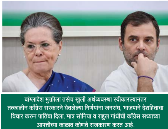
बांग्लादेश मुक्तीला तसेच खुली अर्थव्यवस्था स्वीकारल्यानंतर तत्कालीन काँग्रेस सरकारने घेतलेल्या निर्णयांना जनसभ, भाजपने देशहिताचा विचार करून पाठिंबा दिले. मात्र सोनिया व राहुल गांधींची काँग्रेस संघट्या आपत्तीच्या काळात कोणते राजकारण करत आहे.

इराण-इस्त्राइल युद्धामुळे आणि त्यातील अमेरिकेच्या सहभागामुळे संपूर्ण जगापुढे इंधन टंचाईचे संकट अपेक्षेप्रमाणे उभे ठाकले आहे. या संकटामुळे सर्वसामान्य नागरिकांना गॅस, पेट्रोल, डिझेल यासारख्या इंधनाची टंचाई जाणवणार हे उघडच होते. या संकट काळाला सर्व देशाने एकजुटीने तोंड देणे अपेक्षित असते. इस्त्राइल-इराण या देशात विरोधी पक्षांनीही तेथील सत्ताधार्यांची पाठराखण केली आहे.