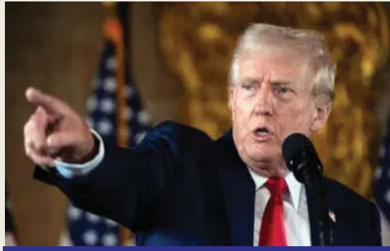
गाझात हाहाकार करून तेथे पर्यटन शहर साकारण्याची घोषणा, व्हेनेझुएलाच्या अध्यक्षीय झोपेघर अपहरण, इराणच्या अध्यक्षसह महत्त्वाच्या नेत्यांची हत्या केल्यानंतर डोनाल्ड ट्रम्प यांच्या निशाण्यावर आता कोणता देश आहे?

मनमानी आणि बेमूर्त कारभारासाठी ख्यात डोनाल्ड ट्रम्प यांनी अमेरिकन अध्यक्षपदाला काळीमा फासला आहे. एकीकडे शांततेचा नोबेल पुरस्कार मिळवा असा हट्ट धरायचा आणि दुसरीकडे कोट्यवधी निष्पाप जीवांशी खेळायचे, अशी त्यांची अहमहमिका आहे. गाझा पट्टीमध्ये शेकडो कुटुंबांना उद्ध्वस्त केल्यानंतर तेथे भय पर्यटन सिटी साकारण्याचा मनसुबा व्यावसायिक ट्रम्प यांनी जाहीर केला. सारे जगच त्याने अचंबित झाले. हे सारे थांबत नाही तोच ट्रम्प यांच्या आदेशाने व्हेनेझुएलाचे अध्यक्ष निकोलस मादुरो आणि त्यांची पत्नी सेलिया फ्लोरेस यांचे पहाटेच्या सुमारास अपहरण झाले. अमेरिकन फौजांनी अध्यक्ष निवासात घुसून ही कारवाई केली. त्यानंतर गेल्या महिन्यात इराणचे सर्वेसर्वा अली खामेनी यांच्यासह सत्ताधारी गटातील अनेक उच्चपदस्थ अधिकारी आणि इस्लामिक रिव्होल्युशनरी गार्ड कॉर्प्सच्या नेत्यांची निर्घृण हत्या करण्यात आली. आंतरराष्ट्रीय कायदे, नियम आणि संकेतांना कराची टोपली दाखवत ट्रम्प यांची ही हुकूमशाही जगासाठी काळाची चिन्ताजनक आहे. आता त्यांनी क्युबा या देशाकडे मोर्चा वळविला आहे.