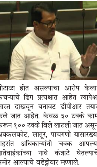
घोटाळा होत असल्याचा आरोप केला. कचऱ्याचे ढिग प्रत्यक्षात आहेत त्यापेक्षा जास्त दाखवून बनावट डीपीआर तयार केले जात आहेत. केवळ ३० टक्के काम करून १०० टक्के बिले लाटली जात असून अक्कलकोट, लातूर, पाचगणी यासारख्या शहरांत अधिकाऱ्यांनी चक्क आपल्या नातेवाईकांच्या नावे कंत्राट घेतल्याचे समोर आल्याचे वडेटीवार म्हणाले.

मुंबई प्रतिनिधी, राज्यातील स्वच्छ महाराष्ट्र अभियान अंतर्गत १२ हजार कोटी रुपयांचा प्रचंड मोठा घोटाळा सुरू असून अधिकारी मंत्र्यांना अंधारत ठेवून सरकारी तिजोरी स्वच्छ करत असल्याचा गंभीर आरोप काँग्रेसच्या विजय वडेटीवार यांनी शुक्रवारी विधानसभेत अर्थसंकल्पातील अनुदानाच्या मागण्यांवरिल चर्चेत सहभागी होताना केला. या घोटाळ्याची एसआयटीमार्फत चौकशी करण्याची मागणीही त्यांनी केली. विधानसभेत नगरविकास, सामाजिक न्याय, इतर मागास बहुजन कल्याण विभागसह पाच खात्यांच्या अनुदानाच्या मागण्या मंजूर करण्यात आल्या. तत्पूर्वी या चर्चेत सहभागी होताना वडेटीवार यांनी नगरविकास खात्याच्या वतीने राबवण्यात येत असलेल्या स्वच्छ महाराष्ट्र अभियानात