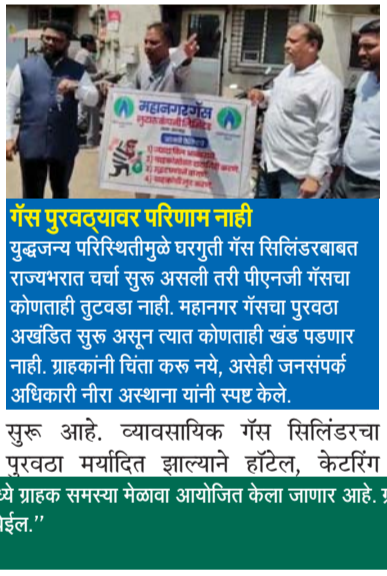
गॅस पुरवठ्यावर परिणाम नाही युद्धजन्य परिस्थितीमुळे घरगुती गॅस सिलिंडरबाबत राज्यभरात चर्चा सुरू असली तरी पीएनजी गॅसचा कोणताही तुटवडा नाही. महानगर गॅसचा पुरवठा अखंडित सुरू असून त्यात कोणताही खंड पडणार नाही. ग्राहकांनी चिंता करू नये, असेही जनसंपर्क अधिकाऱ्यांनी नारा अस्थाना यांनी स्पष्ट केले.

बदलापूर प्रतिनिधी, घरगुती गॅसचा पुरवठा करणाऱ्या महानगर गॅस लिमिटेडविरोधात गुरुवारी राष्ट्रवादी काँग्रेस पक्ष (शरद पवार गट) आणि बहुजन मुक्ती पार्टीतर्फे आंदोलन करण्यात आले. ग्राहकांना वाढीव गॅस बिले येत असून त्याकडे कंपनीकडून सातत्याने दुर्लक्ष केले जात असल्याचा आरोप आंदोलकांनी केला. या पार्श्वभूमीवर ग्राहकांच्या समस्या सोडवण्यासाठी लवकरच ग्राहक मेळावा आयोजित करण्यात येणार असल्याची माहिती महानगर गॅसच्या जनसंपर्क अधिकाऱ्यांनी दिली. सध्या युद्धजन्य परिस्थितीमुळे घरगुती गॅसचा पुरवठ्याबाबत देशभरात चर्चा "ग्राहकांच्या तक्रारी सोडवण्यासाठी लवकरच बदलापूरमध्ये ग्राहक समस्या मेळावा आयोजित केला जाणार आहे. ग्राहकांना तक्रार नोंदवण्यासाठी विविध माध्यमे उपलब्ध असून तक्रार निवारण यंत्रणा आणखी बळकट करण्यात येईल."