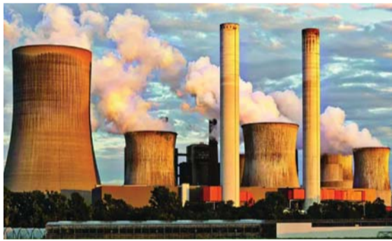
भारताने अणुऊर्जा क्षेत्रात मोठी प्रगती केली आहे. तारापूर येथे पहिले अणुऊर्जा केंद्र सुरू झाले. स्वदेशी तंत्रज्ञानाचा विकास झाला. आता ७०० मेगावॉट क्षमतेच्या अणुभट्ट्या उभारल्या जात आहेत. रशियाच्या मदतीनेही प्रकल्प सुरू आहेत.

त्यामुळे, भारताला एकाच वेळी दोन आघाड्यांवर लढावे लागत आहेत: एक म्हणजे ऊर्जेचा पुरवठा वाढवणे आणि दुसरे म्हणजे हा पुरवठा पर्यावरणाला हानी न पोहोचवणाऱ्या सोतांतून करणे.